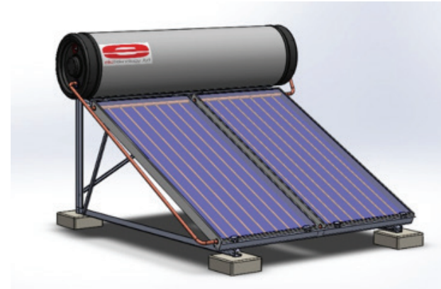
Modèle 300 litres